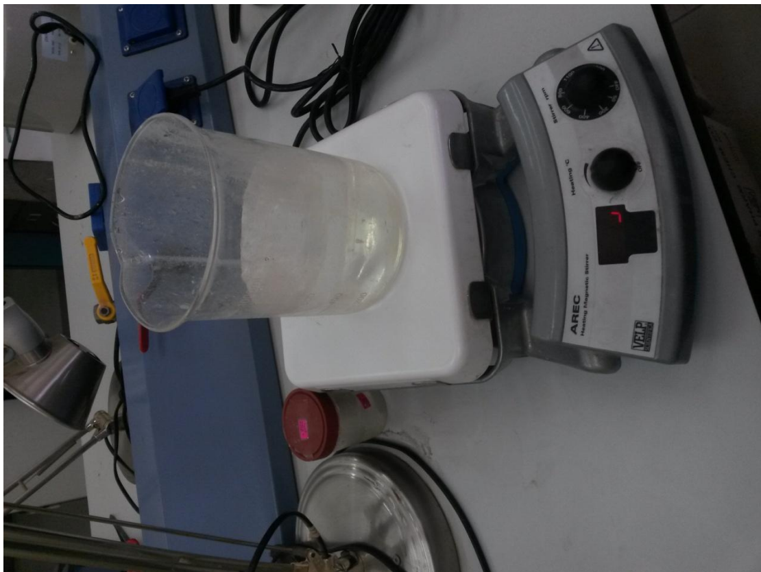
Heating Magnetic Stirrer

مقلب مغناطيسي يستخدم في تحضير السوائل للمواد المختلفه